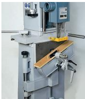
Mesa de trabalho inclinada